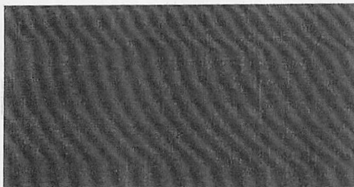
図 3-2 タミフルカプセル75 安定性試験結果 回帰直線 純度試験 ( ) ( ) 包装, ロット番号: ( )