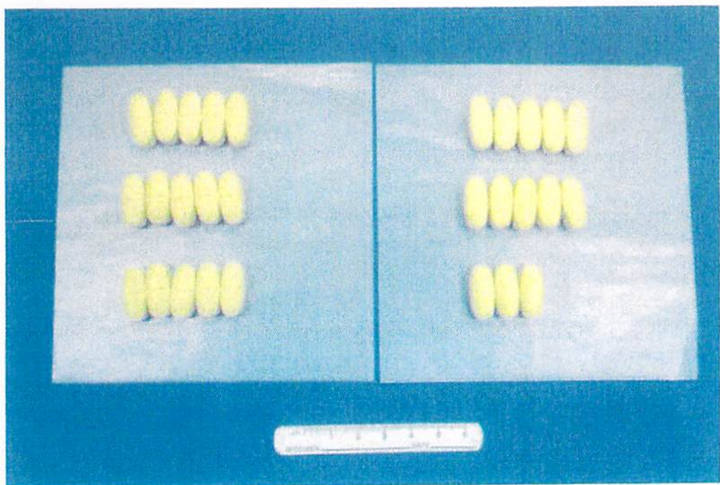
中に入っていた錠剤を薬包紙に並べた様子 (28錠入り)