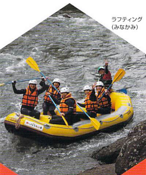
ラフティング (みなかみ)