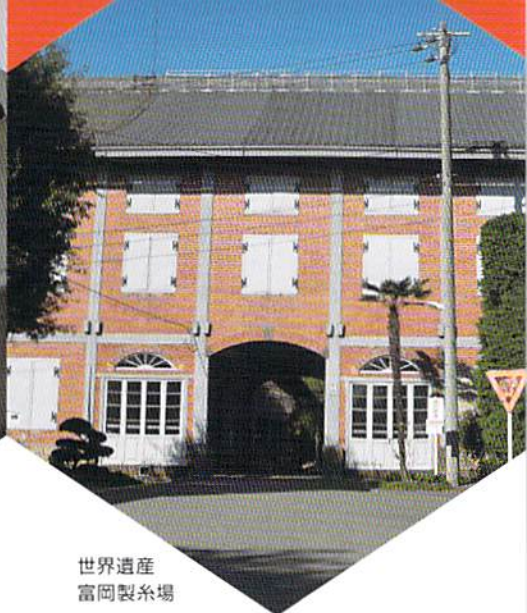
世界遺産 富岡製糸場