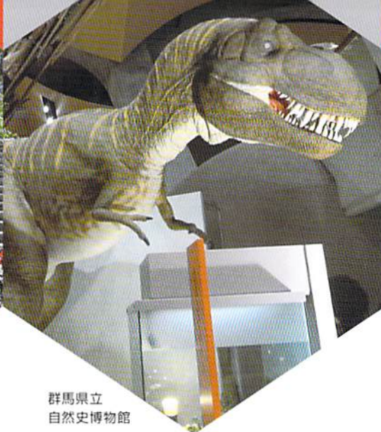
群馬県立 自然史博物館